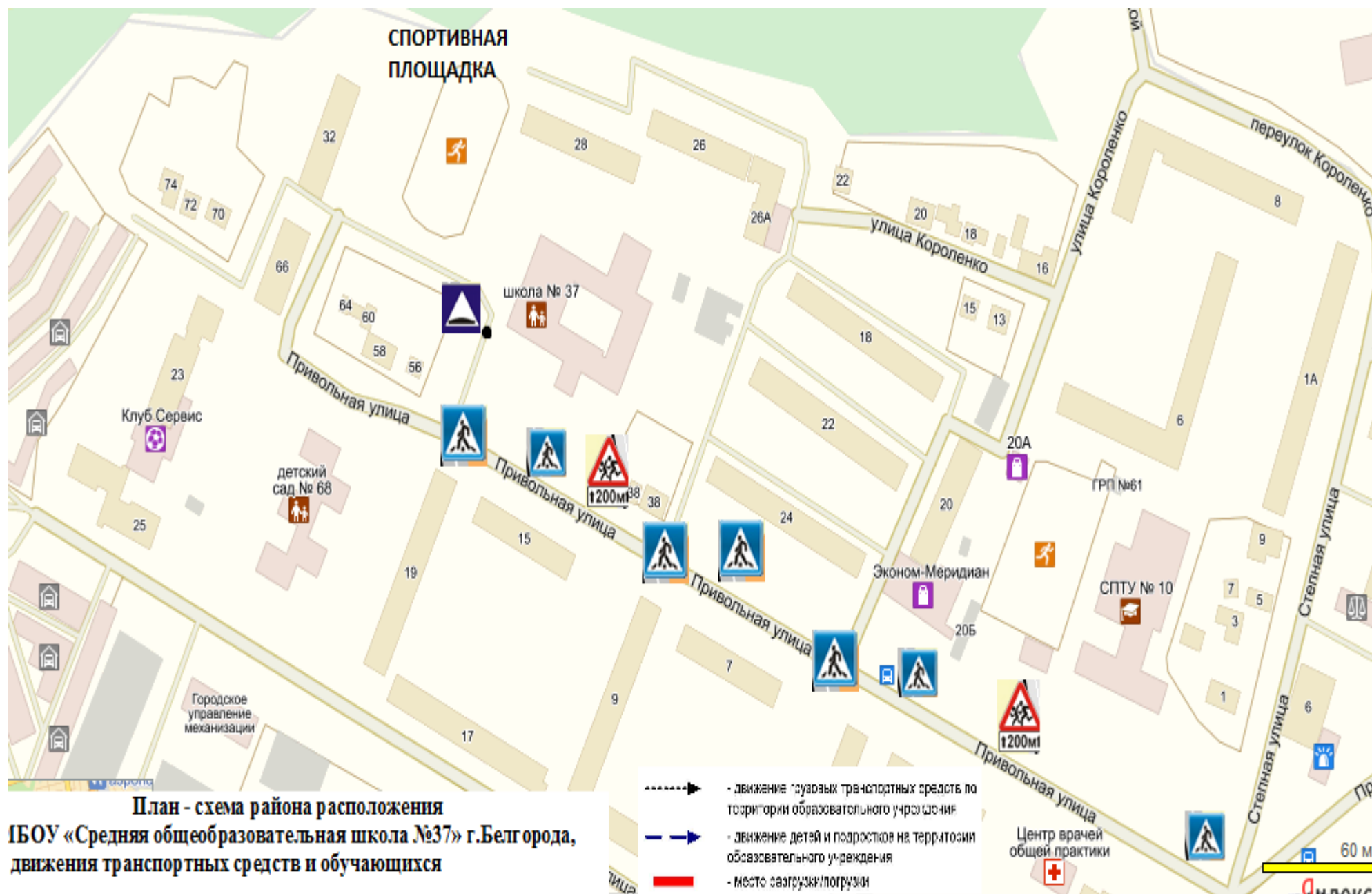
План - схема района расположения ГБОУ «Средняя общеобразовательная школа №37» г.Белгорода, движения транспортных средств и обучающихся